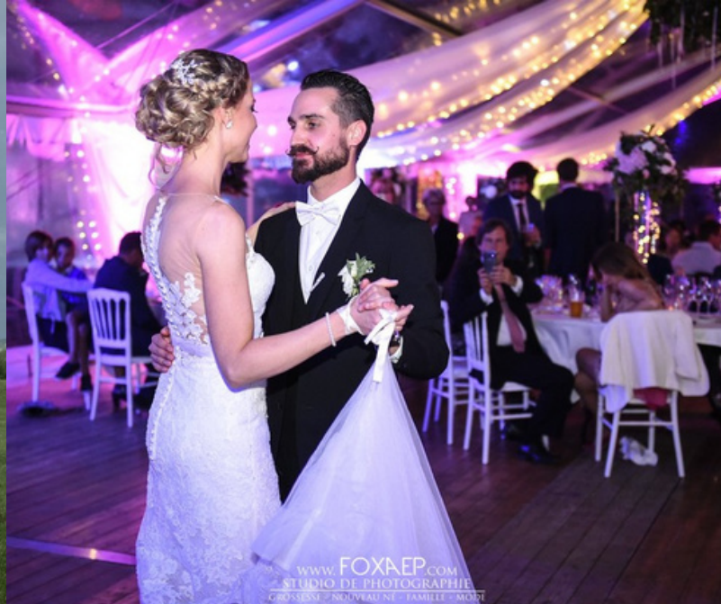
www.FOXREP.COM STUDIO DE PHOTOGRAPHIE GROSSEILLE - NOUVEAU NE - FAMILLE - MOST