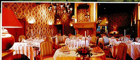
"l'Armançon" restaurant gastronomique, son nouvel écrin !