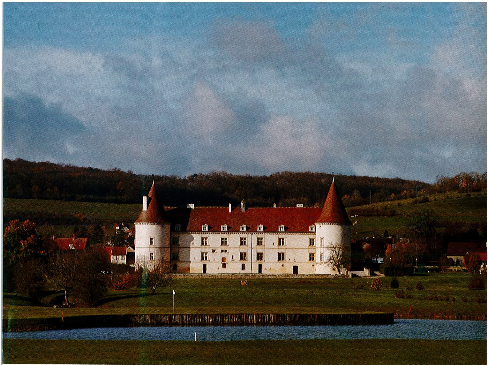
佐多氏はこの地方きっての美しい古城を高級ホテルに甦らせた。全45室。うちスイートは8室。18ホールの素晴らしいゴルフコースもある http://www.chailly.com/

ミシュラン2つ星店を運営していたシェフが、2008年からシャトー・ド・シャイーの厨房に立つ。ブルゴーニュをはじめフランス中の極上素材を使った繊細な料理に、なめらかで気品あるブルゴーニュの銘酒が似合う